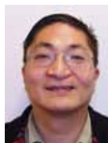
Herr S. ist 42 Jahre Herkunftsland: Südkorea Ausbildungsziel: Fachkraft im Gastgewerbe